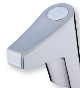
PRESTO Touch simple