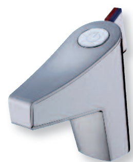
PRESTO Touch mitigeur

Les versions sur plage sont disponibles avec une alimentation par pile ou sur secteur, la version murale est uniquement alimentée par pile.