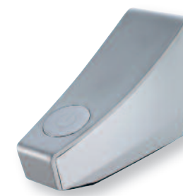
PRESTO Touch mural